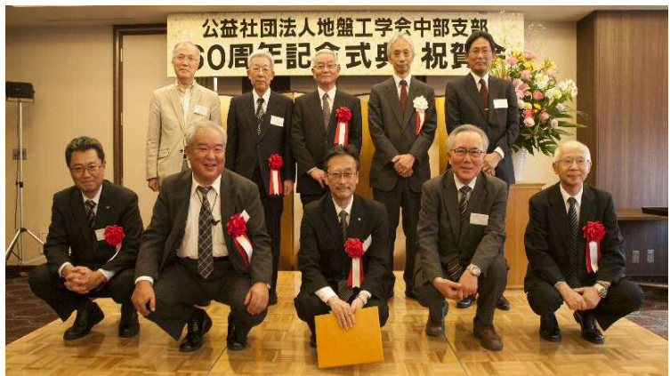
60 周年記念式典において受賞された団体と個人の皆さま