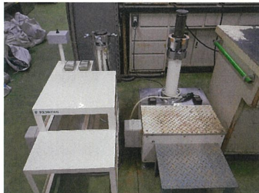
左側:新1号機 右側:2号機